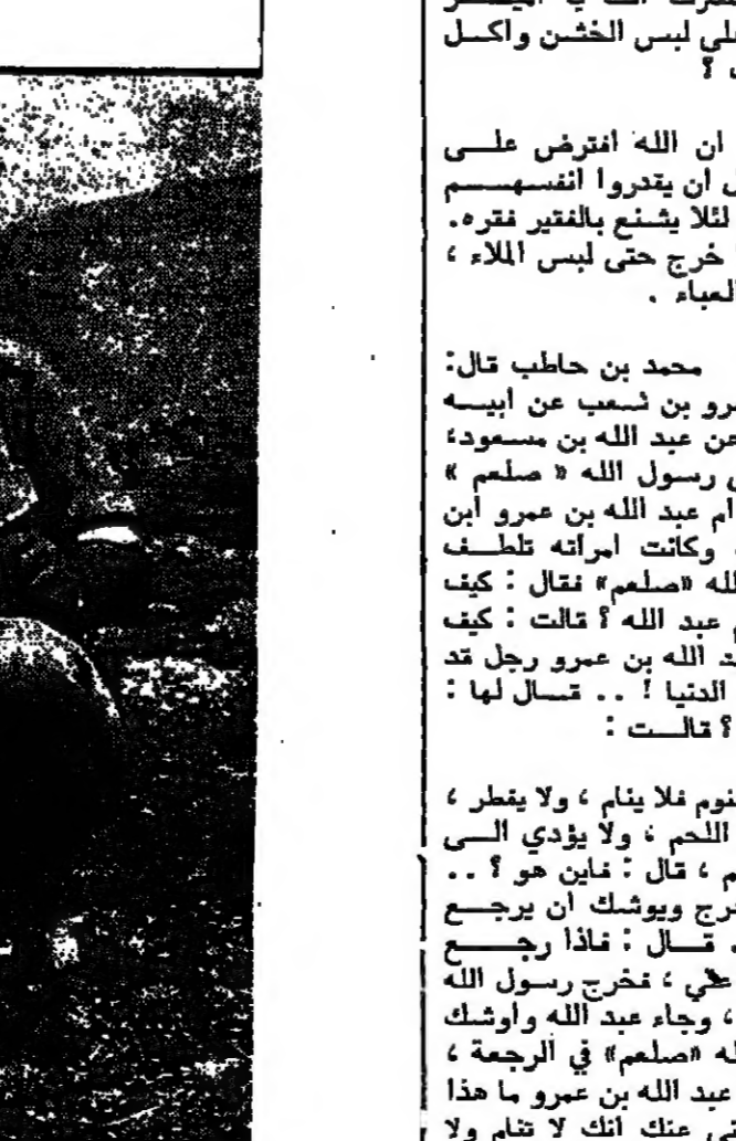
مقدونيا من قرية كركند

خبرة الاجيال التي ورثتها عن اباي وأجدادي هي كثر لا يثمن . الا انها لا تكفي وحدها . فالزراعة اليوم مليئة بالتجديدات والتطورات الفنية الحديثة . ان جودة وكمية المحاصيل تتطلب تكنولوجيا وآليات متطورة . هذه الآليات اثرتيتها بمساعدة القروض الزراعية التي حصلت عليها من البنك الزراعي الهولندي الاسرائيلي .